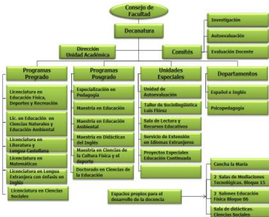
Figura 4. Estructura organizacional de la FCE

El funcionamiento de la Licenciatura depende, a su vez, de la estructura organizacional de la Unidad Académica denominada: Facultad de Ciencias de la Educación, FCE. Dicha organización es jerárquica pero con intereses comunes y procesos de comunicación abiertos que apuntan al posicionamiento progresivo de los programas de la Facultad, entre ellos, la Licenciatura en Literatura y Lengua Castellana. Esa organización es la siguiente: